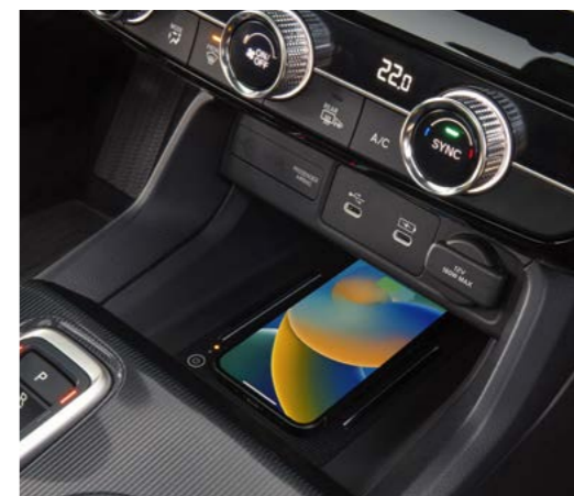
△ BREŽIČNO POLNENJE MOBILNIH NAPRAV