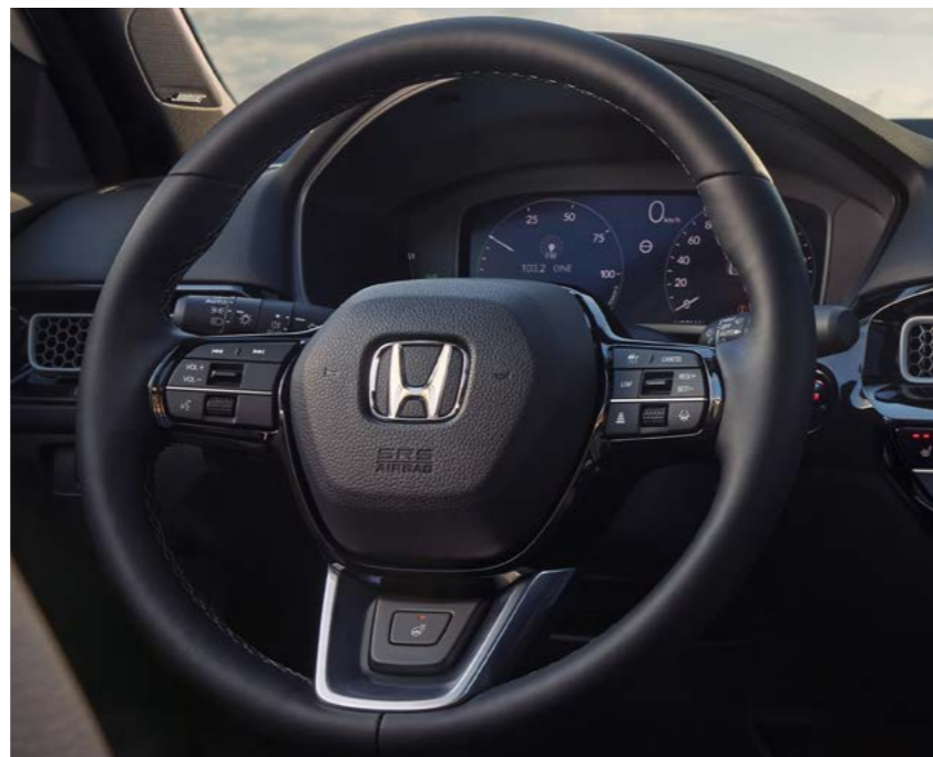
△ MULTIFUNKCIJSKI USNjen VOLAN S FUNKCIJO OGREVANJA*

* See specifications for feature availability