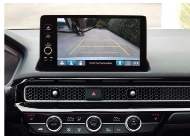
△ VZVRATNA KAMERA Z VEČ POGLEDI