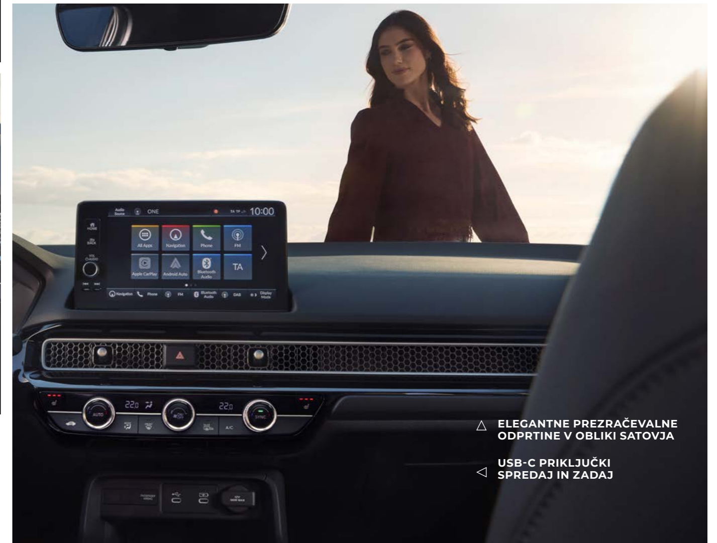
△ ELEGANTNE PREZRAČEVALNE ODPRTINE V OBLIKI SATOVJA