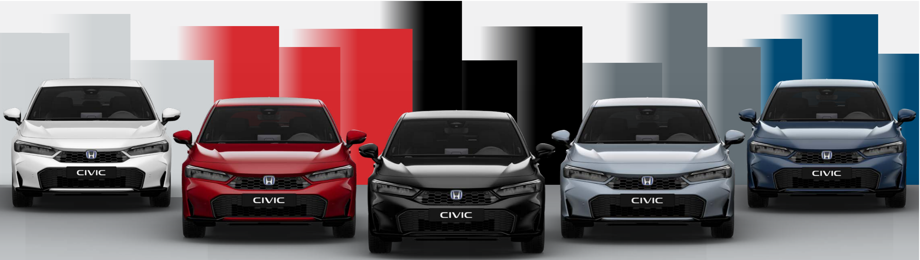
Bela Platinum Biserna