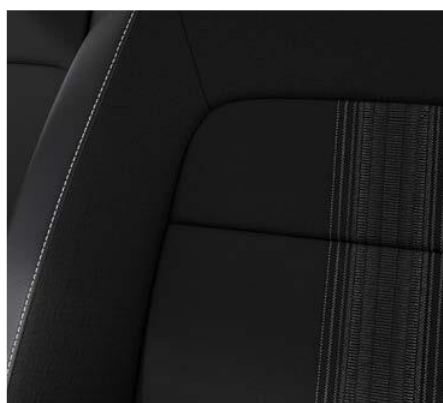
Kombinacija tkanina /usnje za SPORT