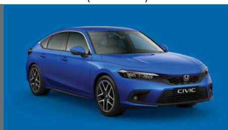
Modra Crystal – kovinska (B-625M)