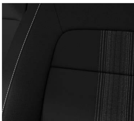
Črno blago – za ELEGANCE