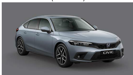
Siva Sonic – biserna (NH-877P)