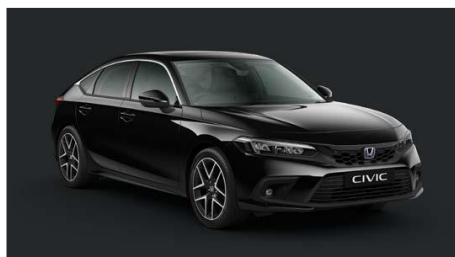
Črna Crystal – biserna (NH-731P)