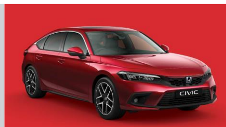
Rdeča Crystal – kovinska (R-565M)