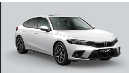
Bela Platinum – biserna (NH-833P)