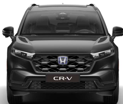
Črna Crystal – biserna (NH-731P)