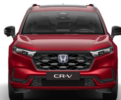
Rdeča Crystal – kovinska (R-565M)