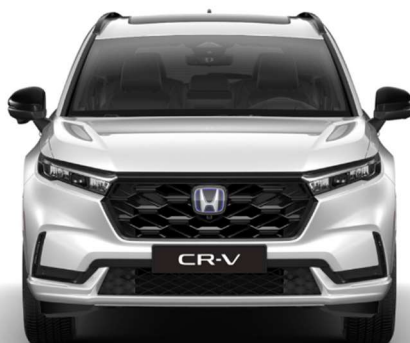
Bela Platinum – Biserna (NH-883P)