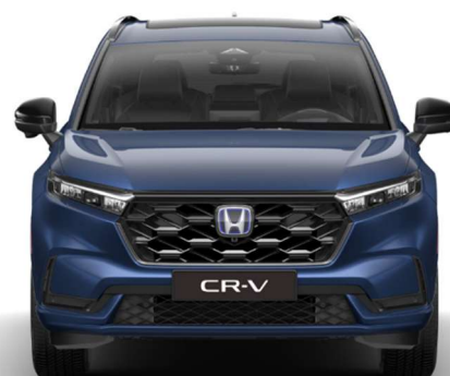
Modra Canyon River – kovinska (B-640M)