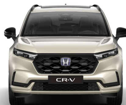
Zlata Titan – biserna (NH-873M)