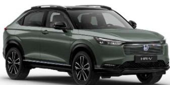
Zelena Sage / črna streha (G-555PA)**