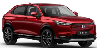
Rdeča Crystal – kovinska (R-565M)*