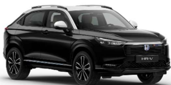
Črna Crystal / srebrna streha (NH-731PA)**