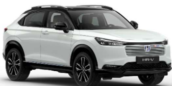
Belo-srebrna Sunlight / črna streha (NH-902PA)**