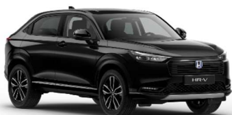
Črna Crystal – biserna (NH-731P)*