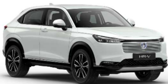
Belo-srebrna Sunlight – biserna (NH-902P)*