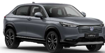
Siva Urban – biserna (NH-912P)*