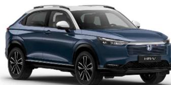
Modra Seabed / srebrna streha (B-645PA)**