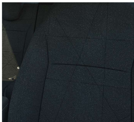
Črna tkanina ELEGANCE