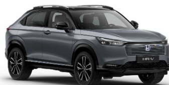
Siva Urban / črna streha (NH-912PA)**