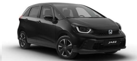
Črna Crystal – biserna (NH-731P)