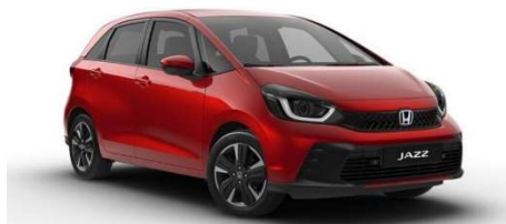
Rdeča Crystal- kovinska (R-565M)