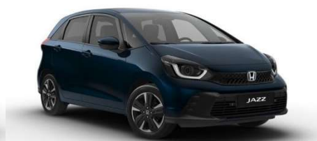
Modra Midnight Beam – kovinska (B-610M)