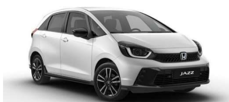
Bela Platinum – biserna (NH-883P)