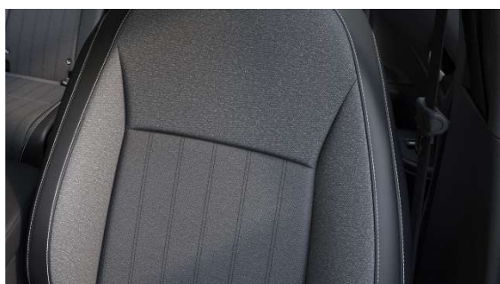
Črna tkanina/usnje – za ADVANCE