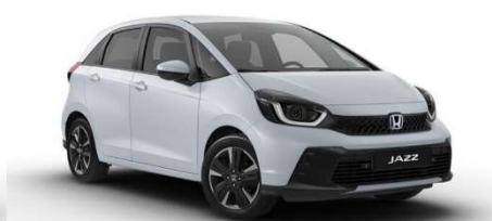
Belo-srebrna Sunlight – biserna (NH-902P)