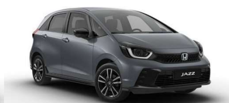
Siva Urban – biserna (NH-912P)