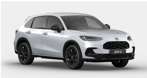
Bela Platinum – Biserna (NH-883P)