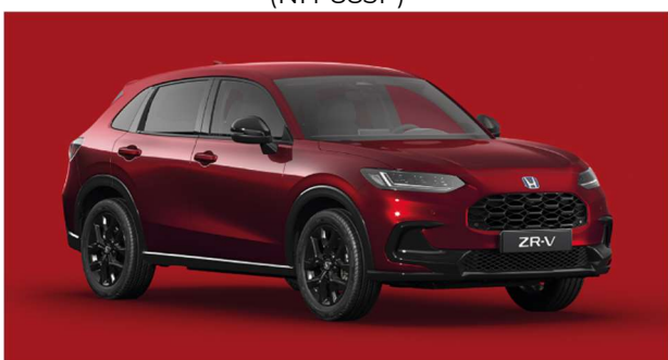
Rdeča Radiant – kovinska (R-569M)