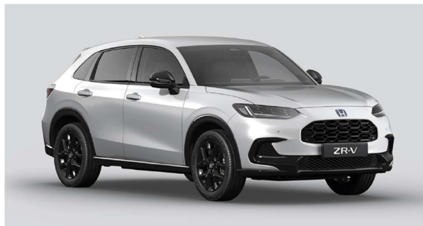
Siva Diamond Dust – biserna (NH-909P)