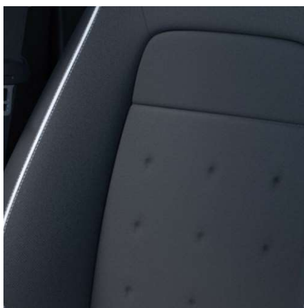
Kombinacija usnje/ tkanina - za Sport