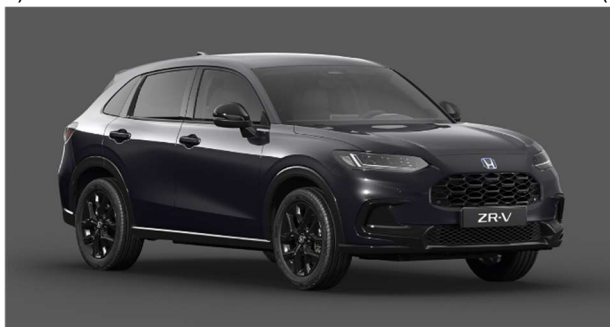
Črna Ruse – kovinska (NH-821M)