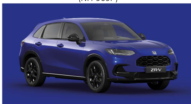
Modra Still Night – biserna (B-575P)