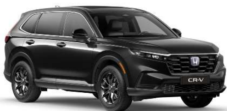
Črna Crystal – biserna (NH-731P)