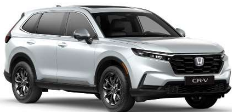
Bela Platinum – Biserna (NH-883P)