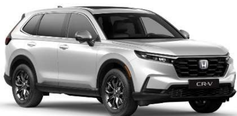
Siva Diamond Dust – biserna NH-909P)