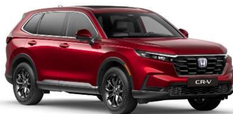
Rdeča Crystal – kovinska (R-565M)