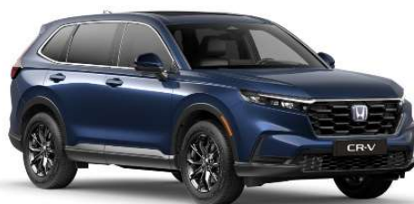
Modra Canyon River – kovinska (B-640M)