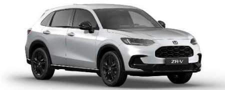
Bela Platinum – Biserna (NH-883P)