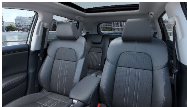
Črno usnje – za Advance