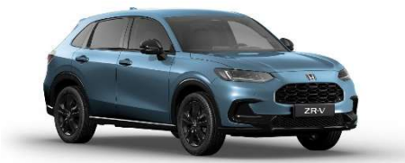
Modra Denim – Kovinska (B-631M)