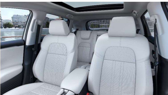
Svetlo sivo usnje – za Advance