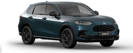
Zelena Nordic Forest – biserna (G-553P)