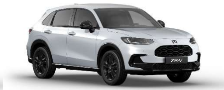
Siva Diamond Dust – biserna (NH-909P)