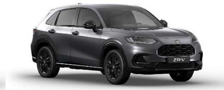
Siva Urban – Biserna (NH-912P)