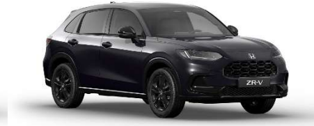
Črna Twinkle – biserna (NH-820P)