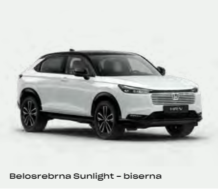
Belosrebrna Sunlight – biserna