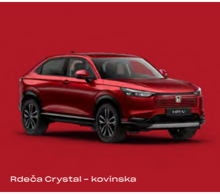
Rdeča Crystal – kovinska