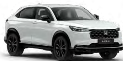
Belo-srebrna Sunlight - biserna