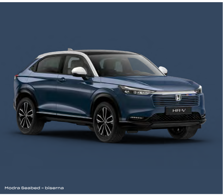
Modra Seabed – biserna