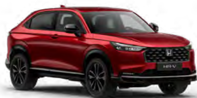
Rdeča Crystal - kovinska