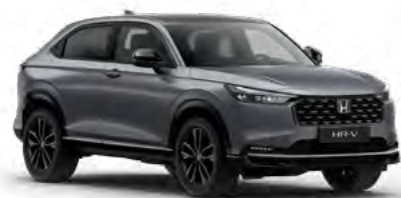
Siva Urban - biserna

Pripravite se na HR-V, ki izstopa z vseh zornih kotov.