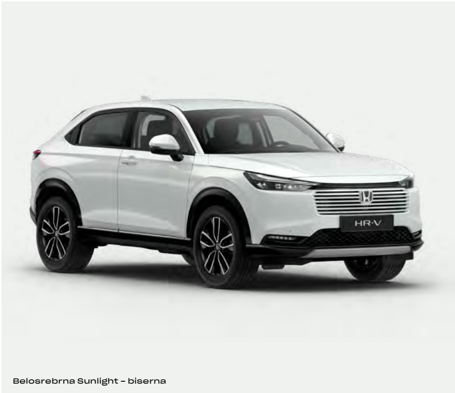
Belosrebrna Sunlight – biserna