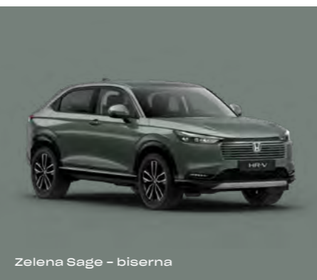
Zelena Sage – biserna