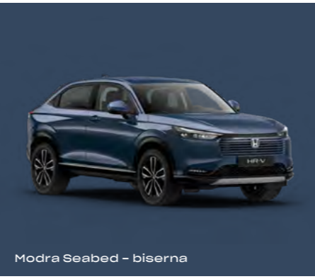
Modra Seabed – biserna