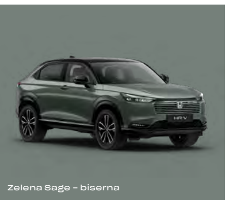
Zelena Sage – biserna