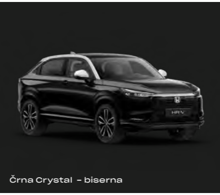
Črna Crystal – biserna