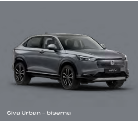
Siva Urban – biserna