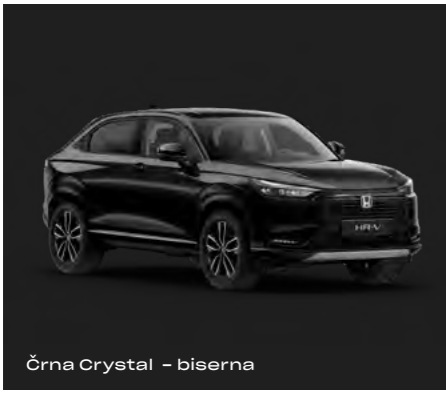
Črna Crystal – biserna