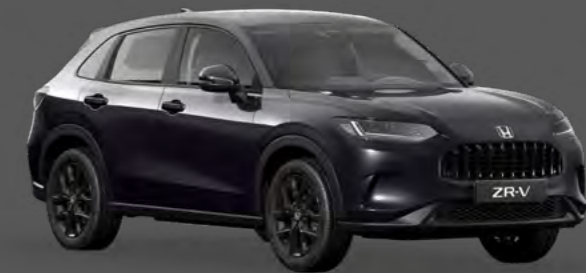
ČRNA TWINKLE BISERNA