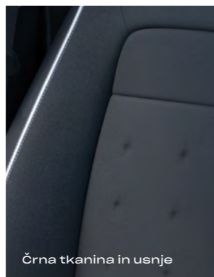
Črna tkanina in usnje