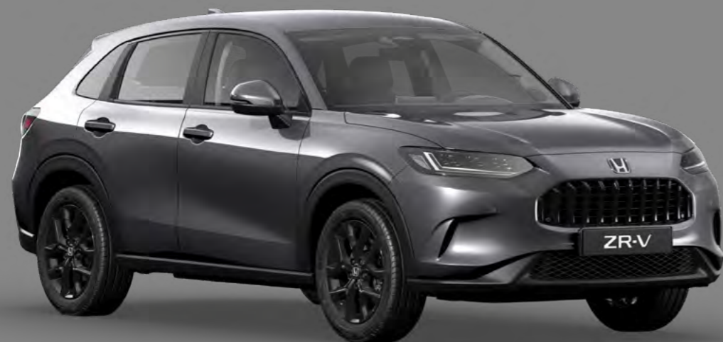
SIVA URBAN BISERNA

Izberajte med paleto sodobnih barv, ki odražajo vašo osebnost in dinamičen slog nove Honde ZR-V.