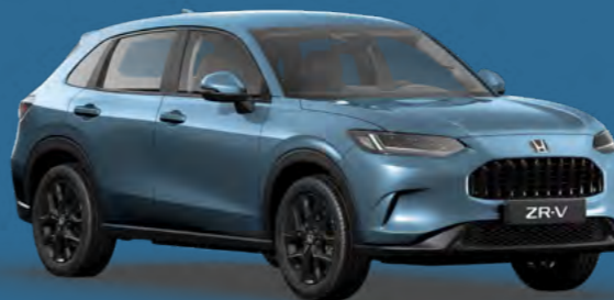
MODRA DENIM KOVINSKA