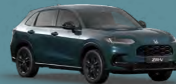
ZELENA NORDIC FOREST BISERNA