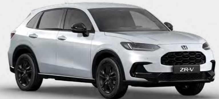
BELA PLATINUM BISERNA