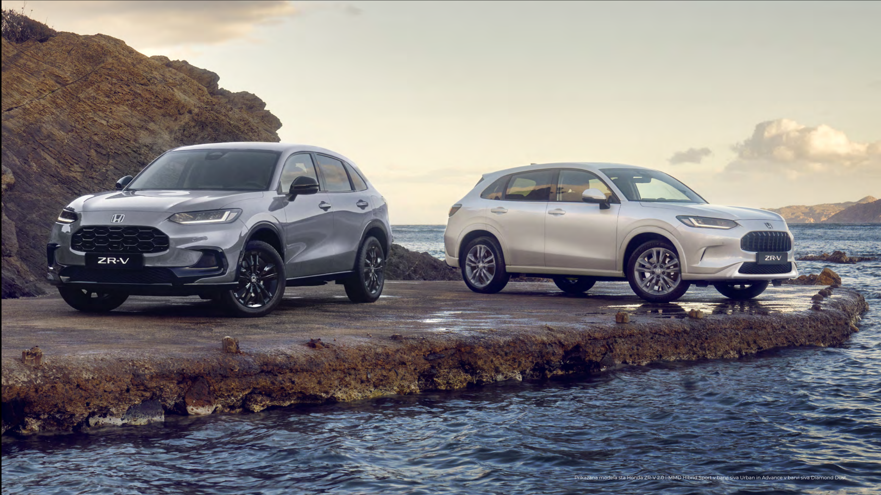
Prikazana modela sta Honda ZR-V 2.0 i-MMD Hibrid Sport v barvi siva Urban in Advance v barvi siva Diamond Dust.