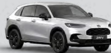
SIVA DIAMOND DUST BISERNA