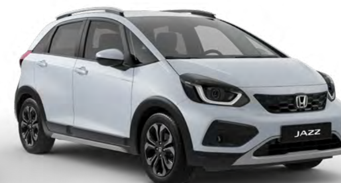
Belo-srebrna Sunlight - biserna