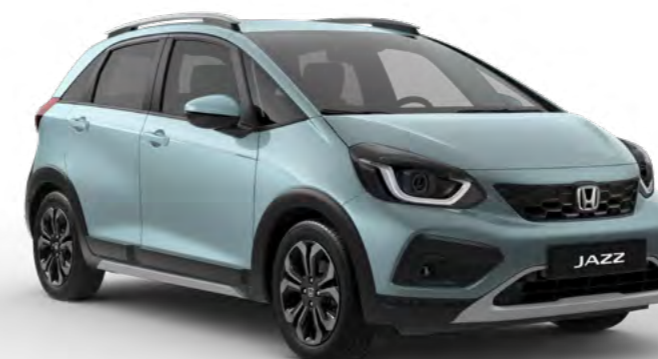
Modra Fjord - biserna