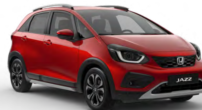
Rdeča Crystal - kovinska