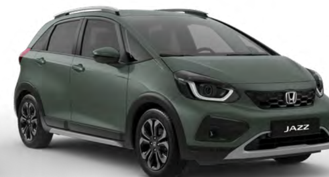
Zelena Sage - biserna