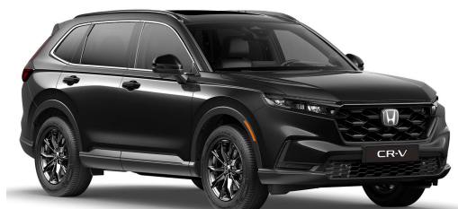
Črna Crystal – biserna (NH-731P)