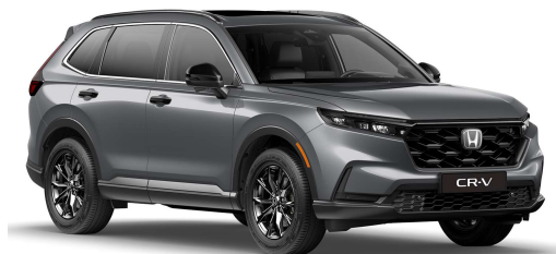
Suva Urban – biserna (NH-912P)