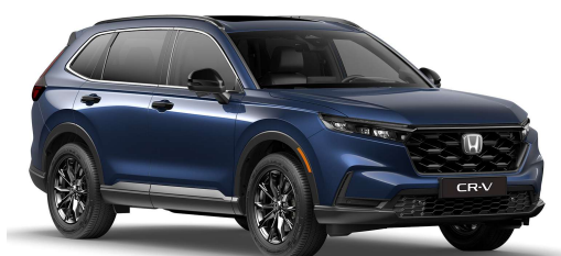
Modra Canyon River – kovinska (B-640M)