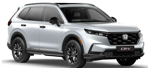
Siva Diamond Dust – biserna (NH-909P)