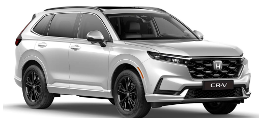
Bela Platinum – Biserna (NH-883P)