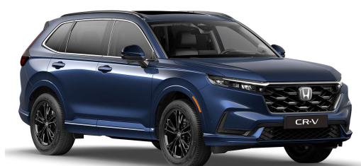
Modra Canyon River – kovinska (B-640M)