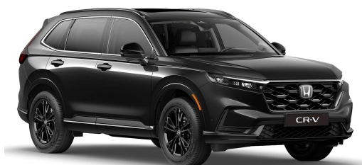
Črna Crystal – biserna (NH-731P)