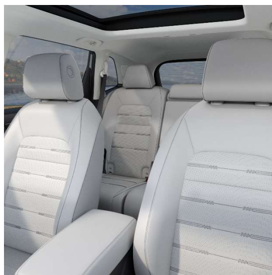
Svetlo sivo usnje