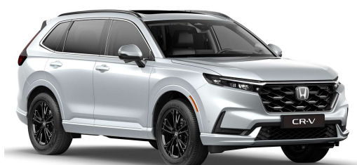
Siva Diamond Dust – biserna NH-909P)