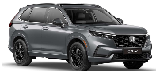
Siva Urban – biserna (NH-912P)