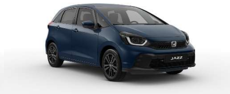
Modra Seabed – biserna (B-645P)