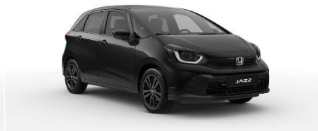
Črna Crystal – biserna (NH-731P)