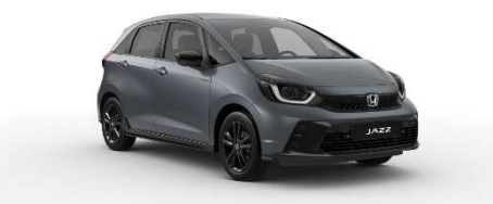
Siva Urban – biserna (NH-912P)