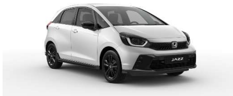
Bela Platinum – biserna (NH-883P)