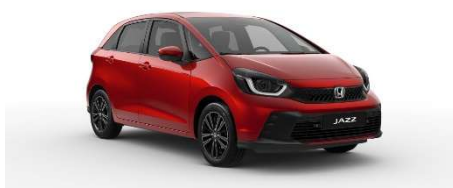
Rdeča Crystal- kovinska (R-565M)