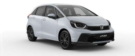
Belo-srebrna Sunlight – biserna (NH-902P)