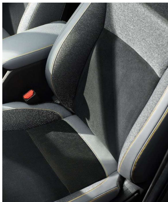
Črno-Siva tkanina/semiš/usnje - za ADVANCE SPORT