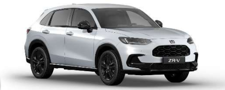
Siva Diamond Dust – biserna (NH-909P)