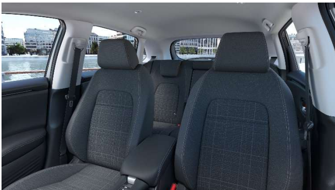
Črna tkanina – za Elegance