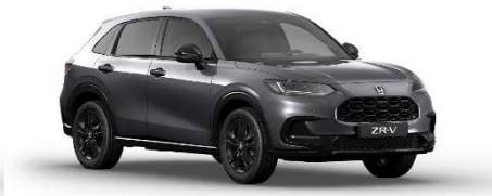
Siva Urban – Biserna (NH-912P)