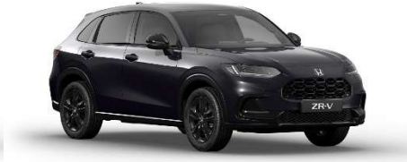
Črna Twinkle – biserna (NH-820P)