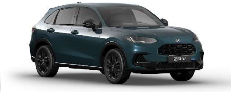
Zelena Nordic Forest – biserna (G-553P)