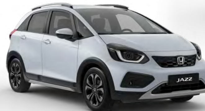
Belo-srebrna Sunlight – biserna