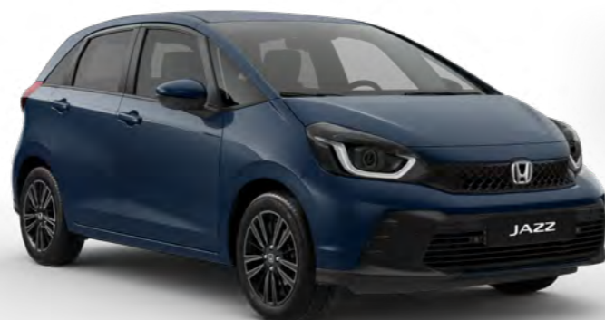
Modra Seabed – biserna