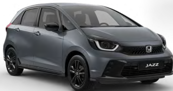
Siva Urban – biserna

Ustvarili smo nabor barv, ki se popolnoma prilegajo karakterju Jazza ne glede na barvo. Notranjosti, ki so komplementarno zasnovane se ponašajo z visoko kakovostnimi materiali in udobnimi sedeži.