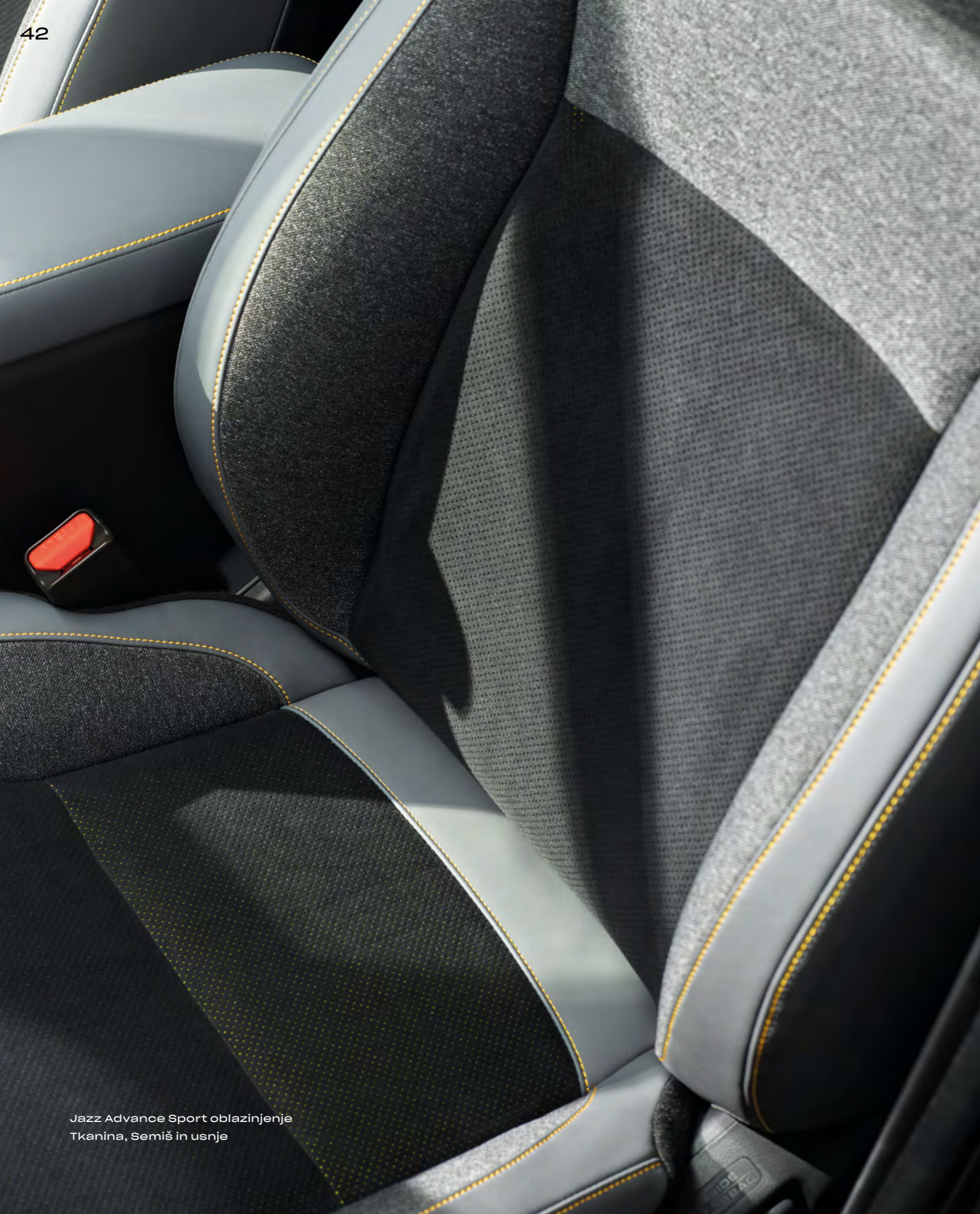
Jazz Advance Sport oblazinjenje Tkanina, Semiš in usnje