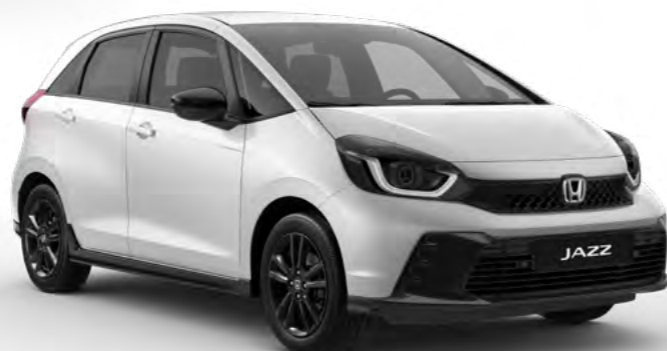
Bela Platinum – biserna