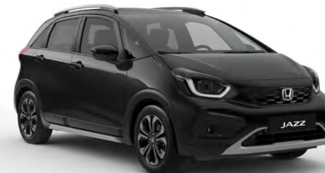
Črna Crystal – biserna