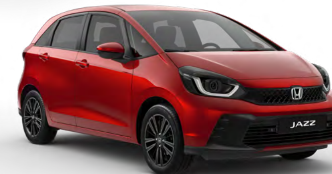
Rdeča Crystal – kovinska