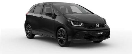
Črna Crystal – biserna (NH-731P)