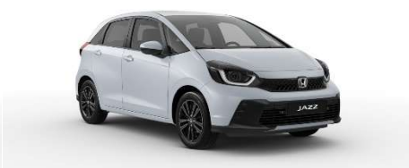
Belo-srebrna Sunlight – biserna (NH-902P)