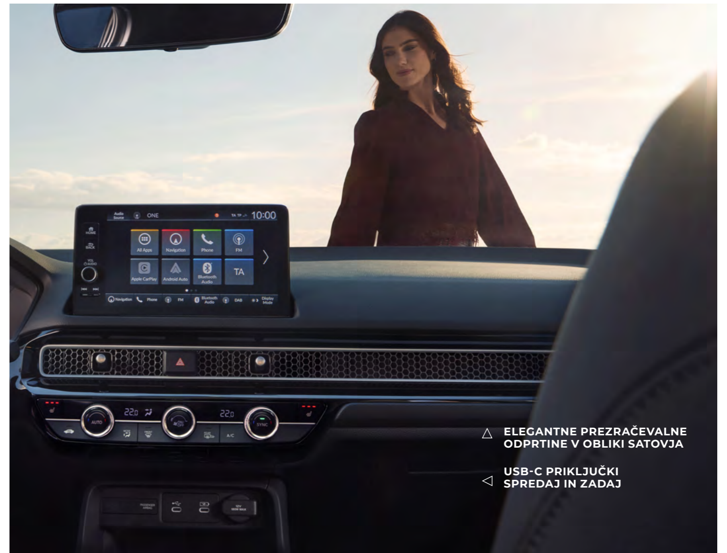
△ ELEGANTNE PREZRAČEVALNE ODPRTINE V OBLIKI SATOVJA