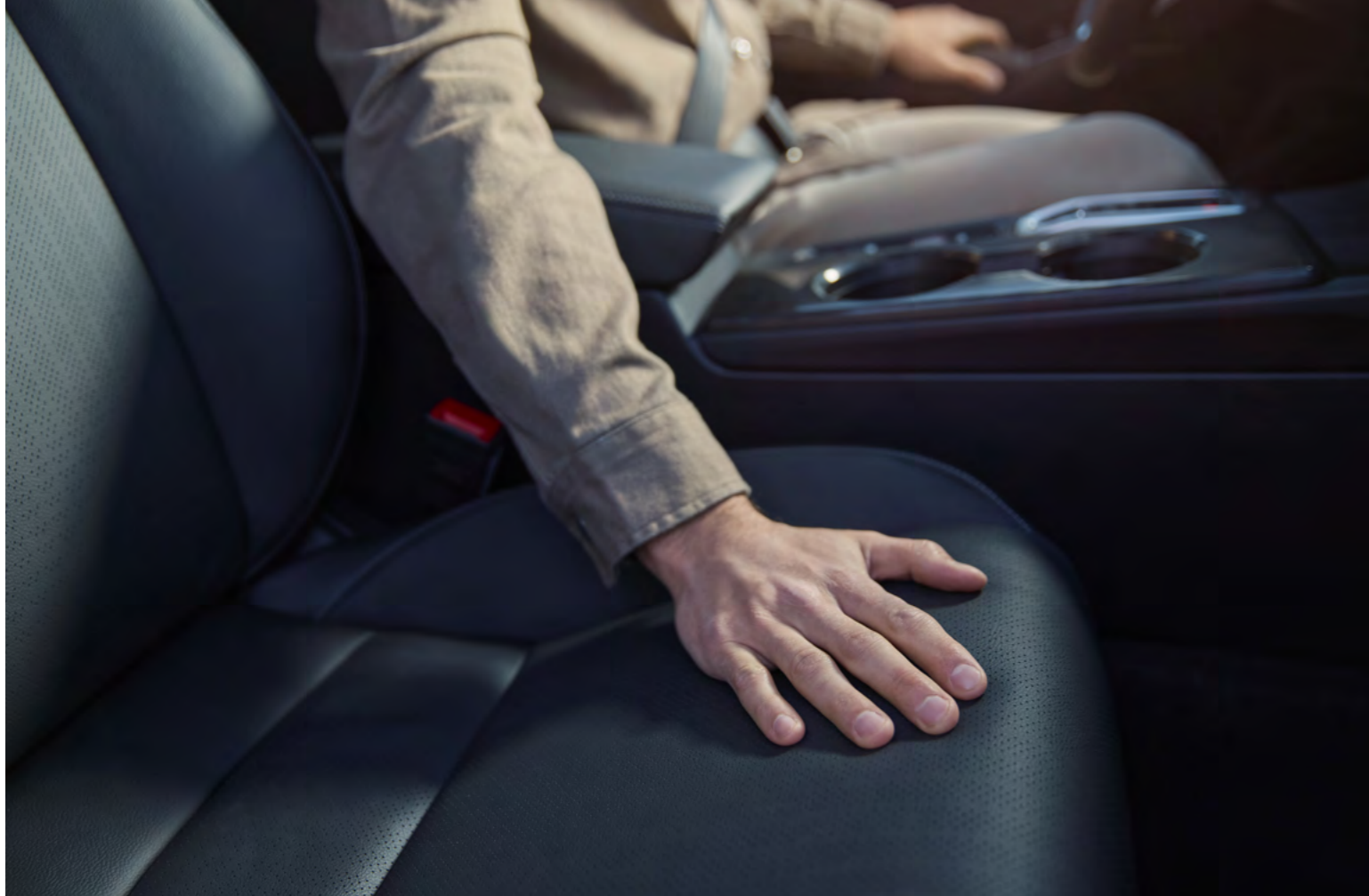
△ ERGONOMSKI PREDNI SEDEŽI S STABILIZACIJO TELESA