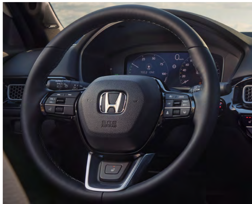
△ MULTIFUNKCIJSKI USNjen VOLAN S FUNKCIJO OGREVANJA*